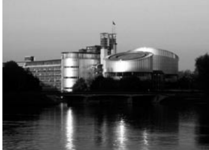
Gerichtshof für Menschenrechte in Straßbourg

Im Rückblick der Jahre 2002 bis 2005, als seitens der kurdischen Guerilla ein Waffenstillstand aus-